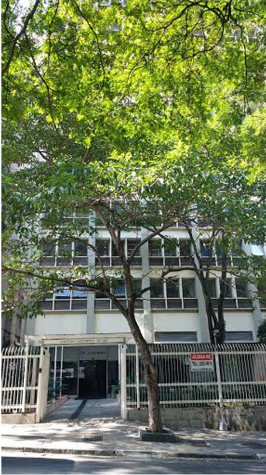
Edifício Columbus, près de la Paulista